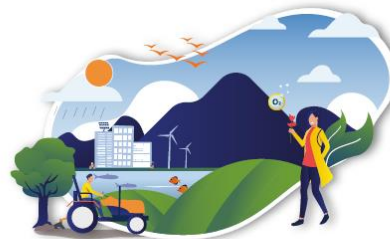
CLIMATE CHANGE MITIGATION AND ADAPTATION