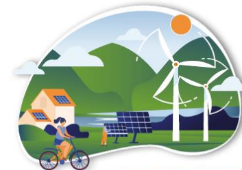
CLEAN ENERGY TRANSITION