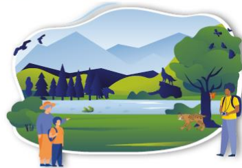
NATURE AND BIODIVERSITY