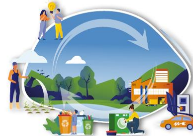
CIRCULAR ECONOMY AND QUALITY OF LIFE