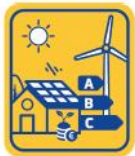
Clean Energy Transition

predecessors: Intelligent Energy Europe continued under H2020- SC3- market uptake